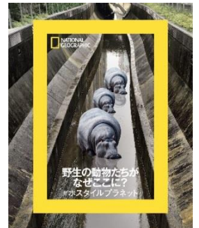
番組告知グラフィックイメージ